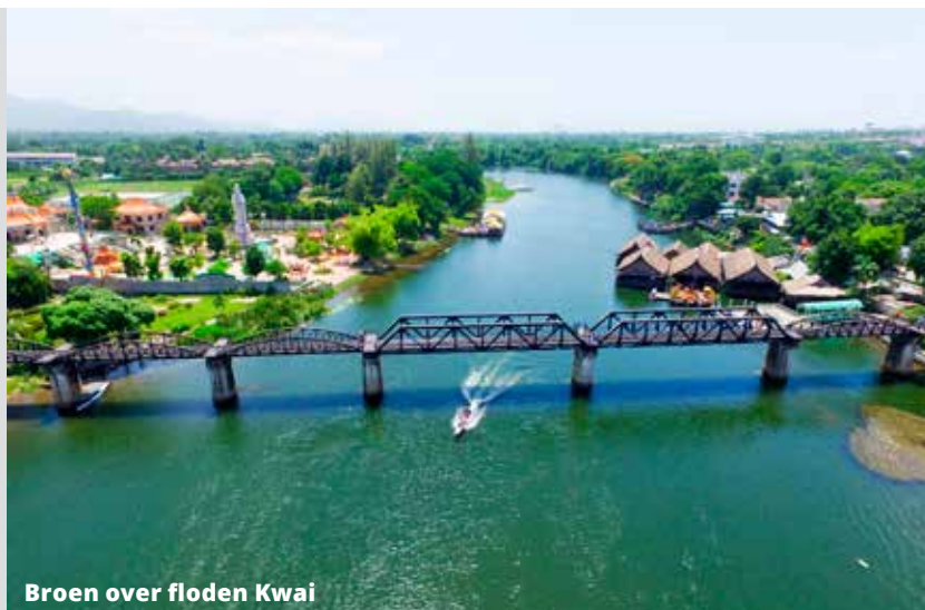
Broen over floden Kwai

Historien griber os også på mindeskirkegården og Thai-Burma Museet og står i kontrast til de naturskønne omgivelser.