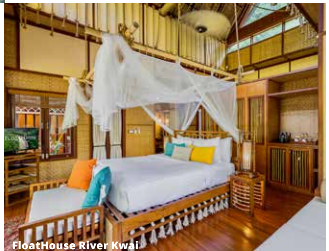
FloatHouse River Kwai